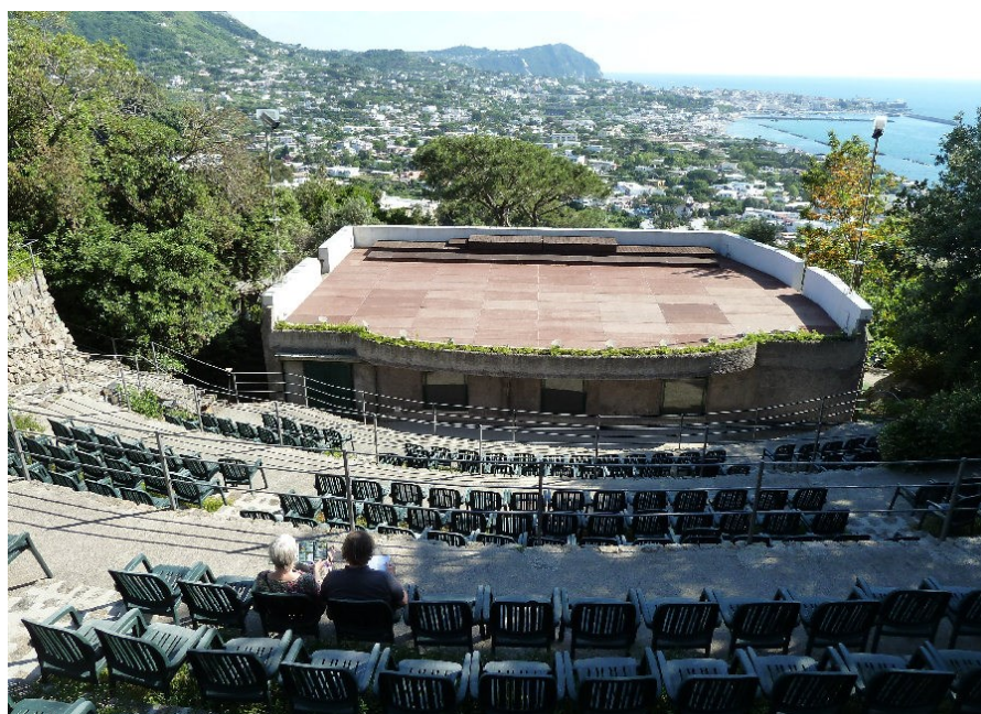
Teatro Græco "La Mortella Forio d'Ischia